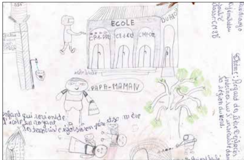
De terroristen schieten en steken de huizen in brand. Een kind komt thuis uit school en vindt zijn vader en moeder dood met doorsneden kelen.