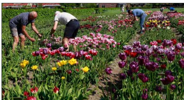
Vrijwilligers aan het werk.