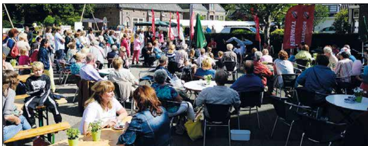
De gezellige jaarmarkt is dit jaar gecentreerd rondom het park aan de Vuurbaak.