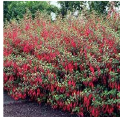
Winterharde Fuchsia "Riccartonii"