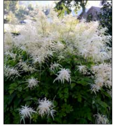
Winterharde Aruncus Sylvester