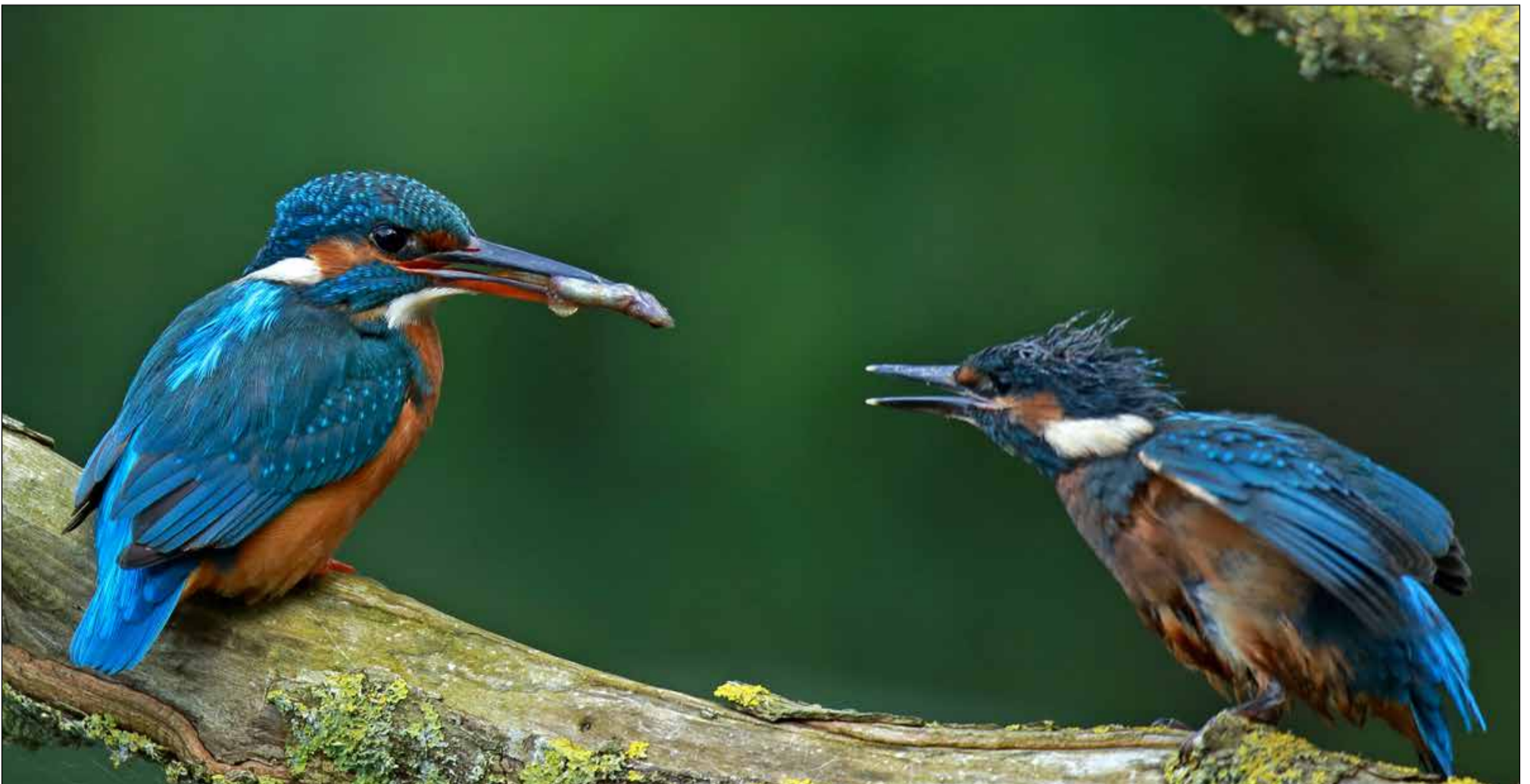
'Moeder' ijsvogel voedt hier èèn van haar jonkies... Prachtig in beeld gebracht door fotograaf Peter van Renen.