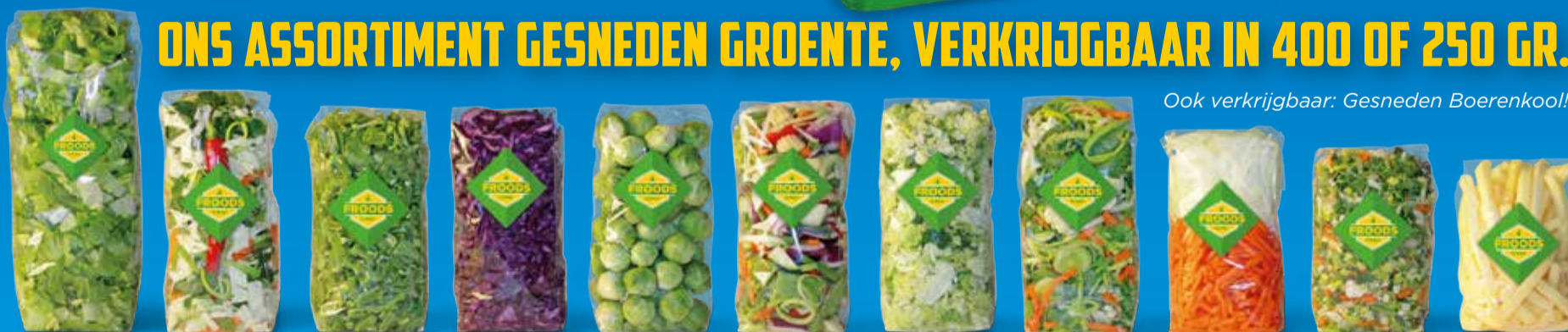
Andijvie Bami Pakket Snijbonen Rode Kool Spruitjes Wok Mix Groene Kool Soepgroente Grof Hutspot Soepgroente Fijn Koolnaap