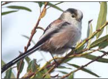
Staatmees ( Aegithalos caudatus ), trekvogel.

Er zijn nog steeds trekvogels op doortocht. Vorige week zag ik aan de Dampegheestlaan een flinke groep staartmezen in de bosschages rondom de voetbalvelden. Langs alle takken omhoog kruipend op zoek naar kleine insecten en luizen. Ook zijn er al veel smienten in de vaarten in