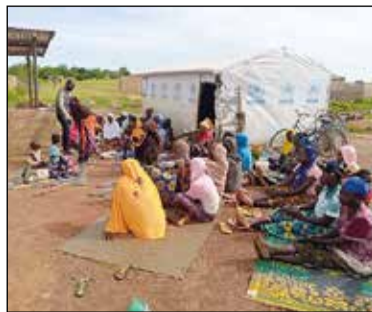
Vluchtelingenkamp aan de rand van Ouahigouya.

ze een paar mensen en steken huizen, winkels en voorraadschuren in brand. In vijf jaar tijd is Burkina Faso van een van de veiligste landen in Afrika geworden tot een van de gevaarlijkste landen. Bijna twee miljoen mensen hebben hun dorp verlaten en een veilig heenkomen gezocht in de steden. Ze hebben bijna niets mee kunnen nemen. Eten is er nauwelijks, want tot overmaat van ramp is er ook nog te weinig regen gevallen en is de oogst