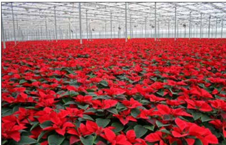
De kerstster ook wel Poinsettias volop in bloei bij de kweker.

In de huiskamer worden ook veel Kerststerren neergezet. Deze heten eigenlijk Poinsettia of Euphorbia. Verkrijgbaar in wit, roze, rood en vele roodschakeringen. Kijk op Wikipedia voor meer informatie over deze mooie planten. Buiten bloeit nu of binnen enkel weken de Helleborus, ook wel genoemd Kerstroos, Nieskruid e.d. Deze plant is niet geschikt voor de woonkamer, maar heel mooi