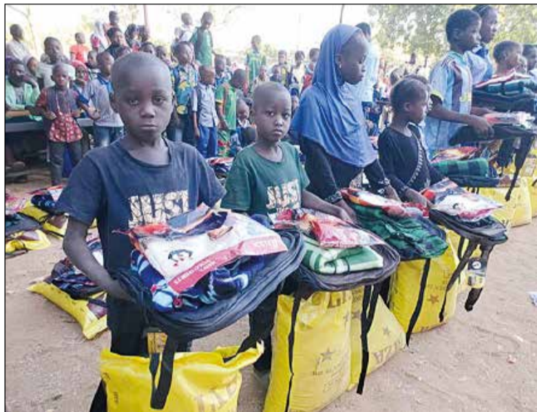
Ontheemde leerlingen ontvangen hun spullen op Onderwijscomplex Zoodo.