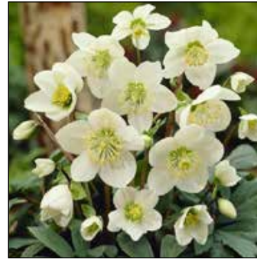
Helleborus, geschikt voor pot en vollegrond.